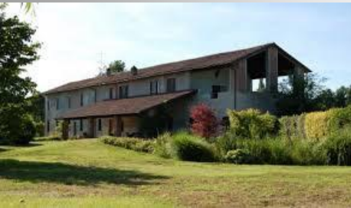
LA FATTORIA TOSCANA