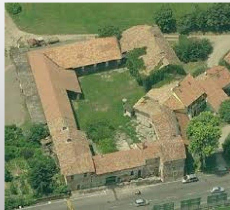
LA CORTE LOMBARDA