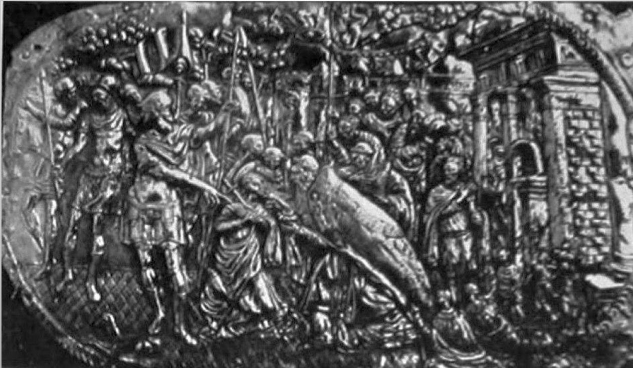
PART. DELLA CASSA - LA COMUNIONE DI S. LUCIA

In questo ultimo pannello viene rappresentata la Comunione di S. Lucia. La scena è ricchissima di particolari su cui grandeggia la figura del Vescovo che somministra il pane eucaristico. Colpisce il sapiente utilizzo dello spazio in cui si addensano le varie figure.