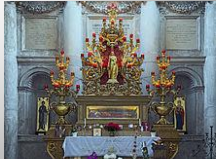
VENEZIA - CHIESA DI SAN GEREMIA