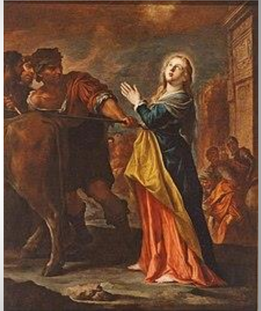
PIETRO NOVELLI - S. LUCIA VA AL MARTIRIO