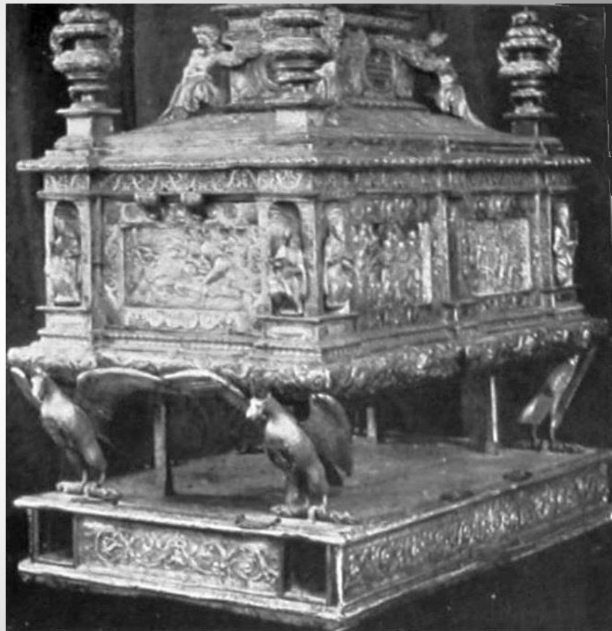
CASSA ARGENTEA DI S. LUCIA

Elemento altamente decorativo è la “cassa” che è composta da sei pannelli che raffigurano episodi della vita della Martire. L’analisi stilistica, la forma ovale ed il successivo riadattamento, inducono gli studiosi a datare quattro dei sei pannelli al XVI sec. E’ probabile che furono riutilizzati da una precedente urna reliquiaria. La “cassa” reca sui lati i sei pannelli di cm 44x 27, due nei lati lunghi e uno nei lati corti. E’ sorretta da quattro aquile con le ali spiegate e nel petto recano lo stemma della città. Agli angoli pilastri in argento nei quali spiccano nicchie contenenti immagini di vescovi e quattro artistici vasi di fiori che completano la decorazione. Con la sotto cassa il simulacro raggiunge l’altezza di 3,70 metri secondo i modelli statuari del ‘600 e ‘700.