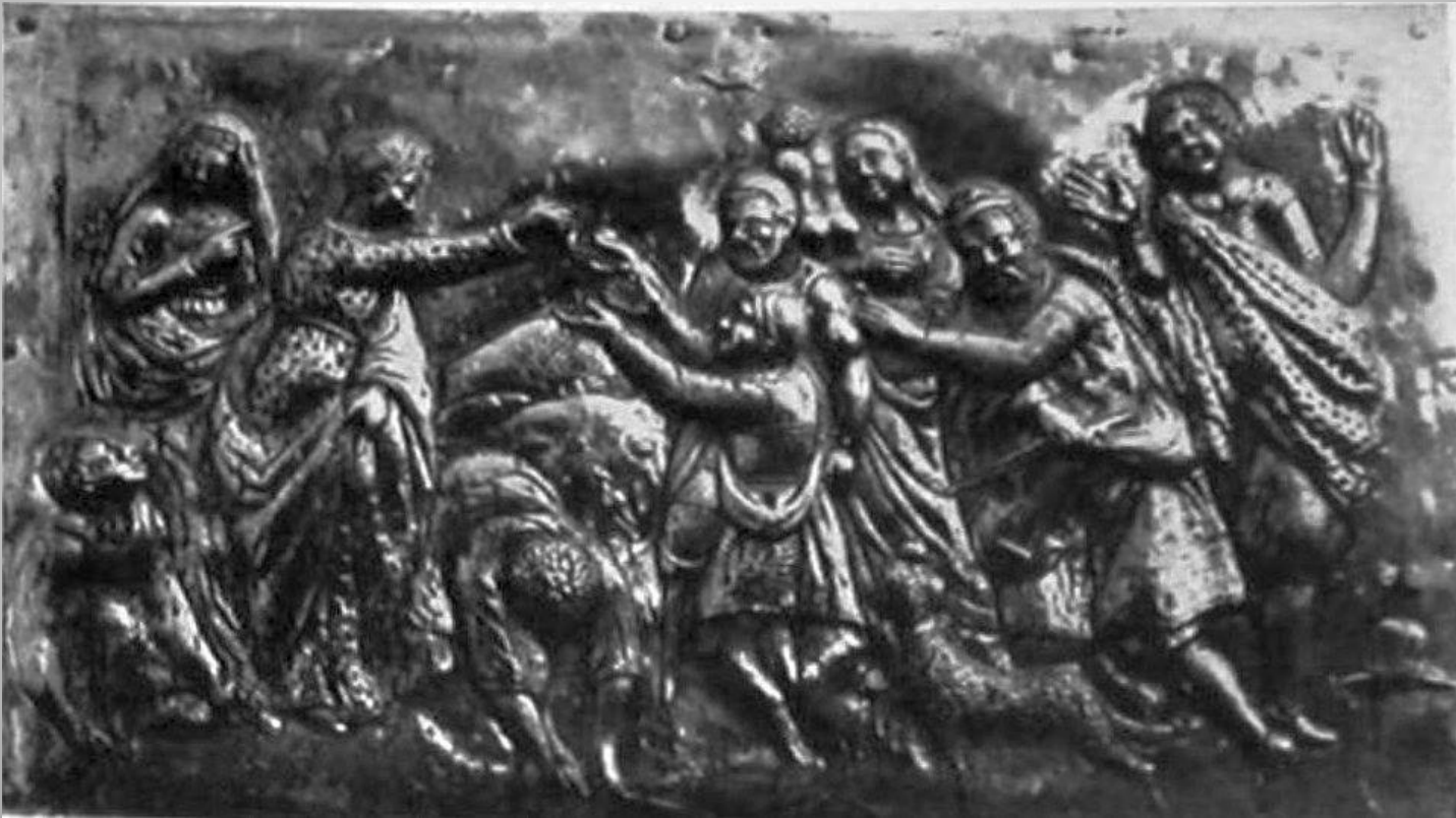
PART. DELLA CASSA - S. LUCIA DISTRIBUISCE AI POVERI LE SUE SOSTANZE

Nel secondo pannello è raffigurata una scena non molto presente nell'iconografia luciana; la Santa che dispensa i suoi averi ai poveri. La presenza del cane rende più vivace la scena.