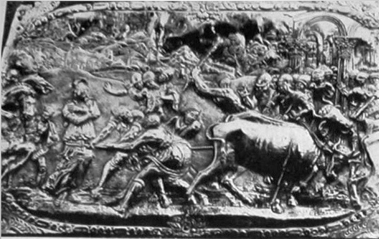
PART. DELLA CASSA - L'IMMOBILITÀ DELLA SANTA

Nel pannello è riprodotto il prodigio della Santa immobile nel tentativo di essere trascinata dai buoi. Ricca di movimenti la scena è molto curata nella rappresentazione quasi scultorea dei buoi.