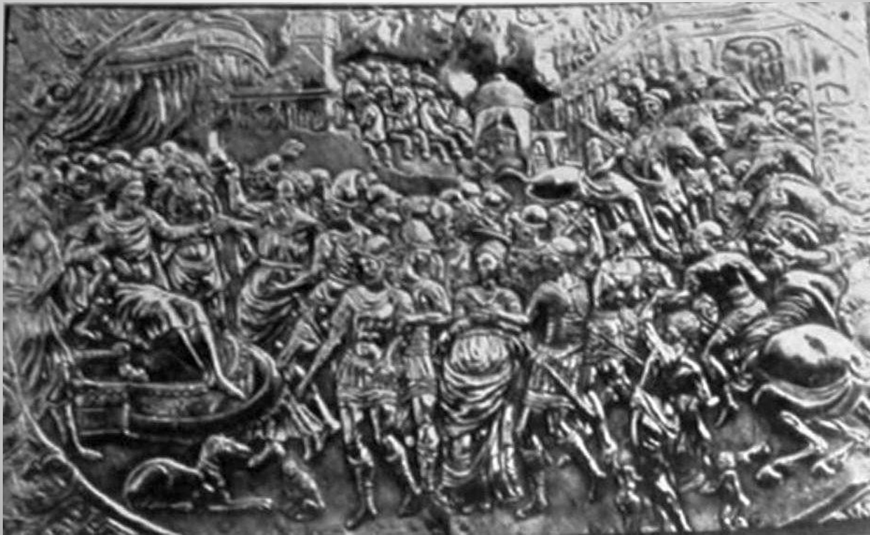
PARTICOLARE DELLA CASSA - L'INTERROGATORIO DI S. LUCIA

Negli altri quattro pannelli la tecnica costruttiva è più vivace, presenta molte figure distribuite su piani multipli. Nel primo è raffigurato l'interrogatorio della Santa che si svolge in un'ampia piazza circondata da edifici mentre molti soldati si muovono nella scena. La figura dominante è il tiranno.